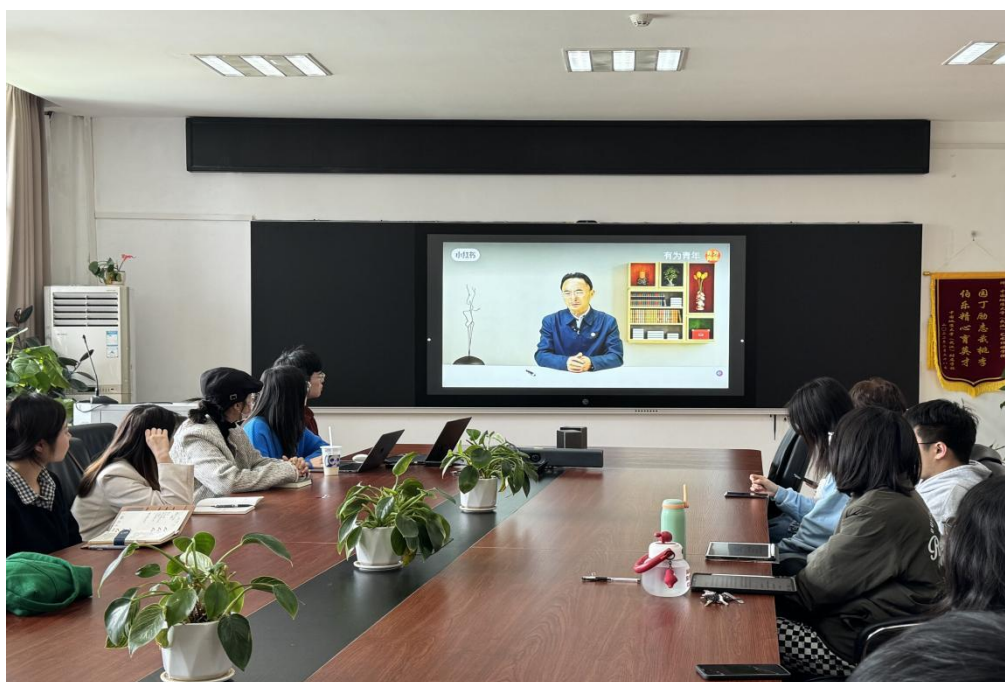
图 2 学生集中观看视频课程二