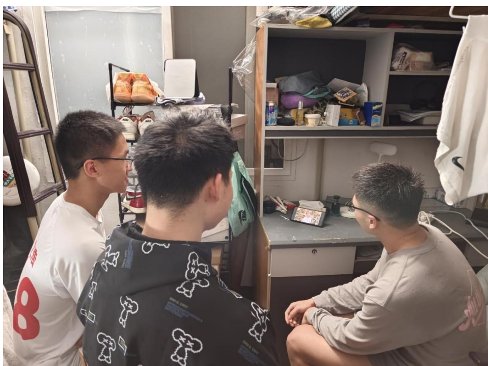
图 4 学生在宿舍内进行线上学习