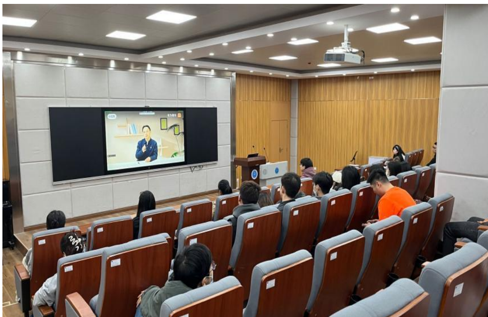
图 1 学生集中观看视频课程一