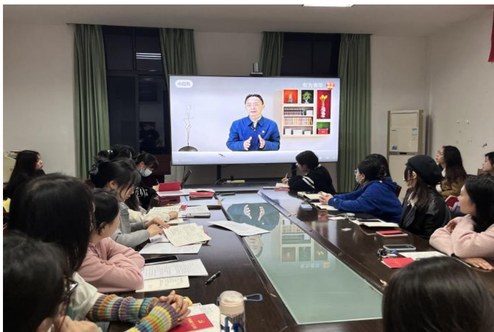
图 3 学生集中观看视频课程三