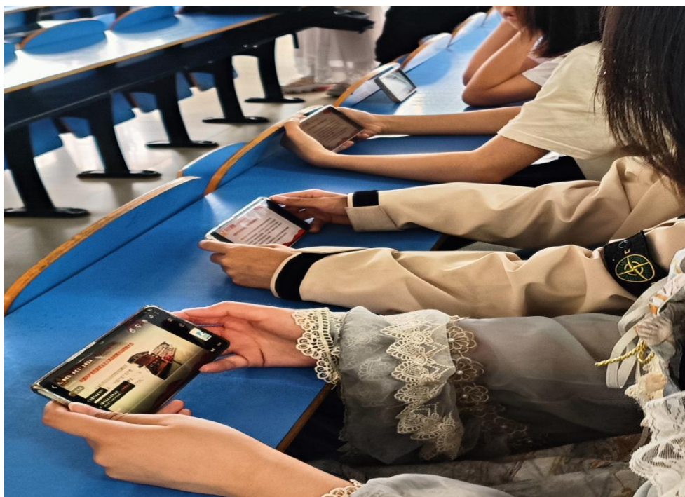
图 5 学生观看视频课程