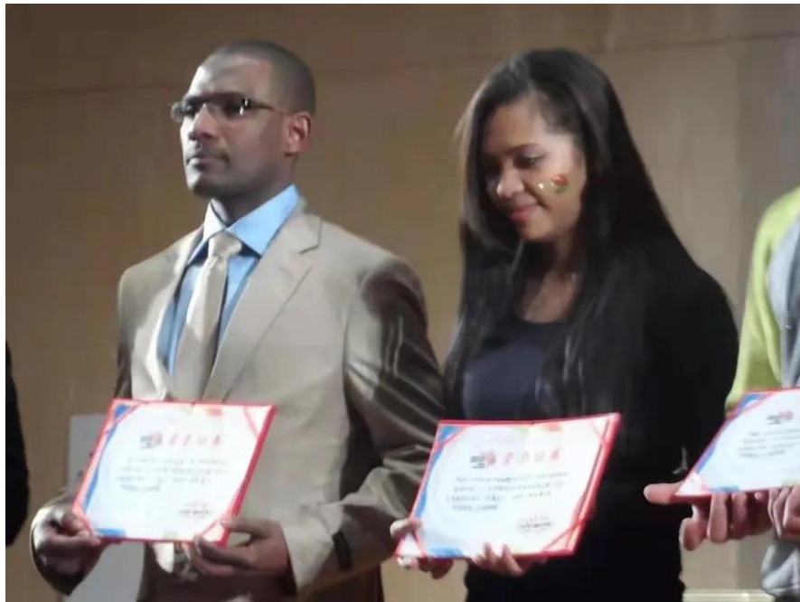
2012 年阿拉丁参加留动中国比赛时获奖照片