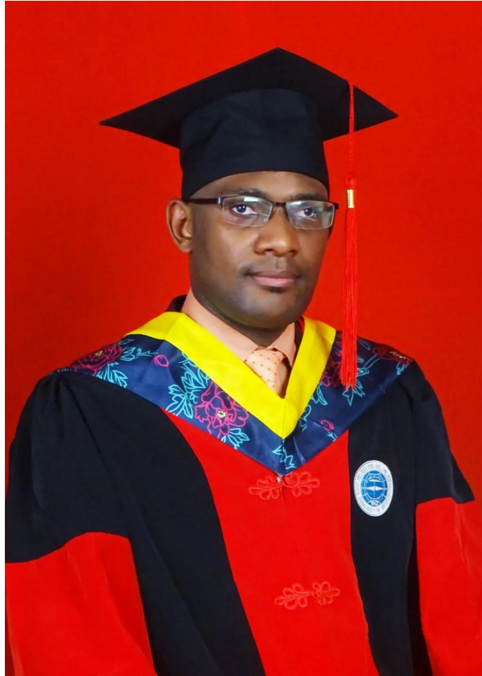
阿拉丁博士纪念照