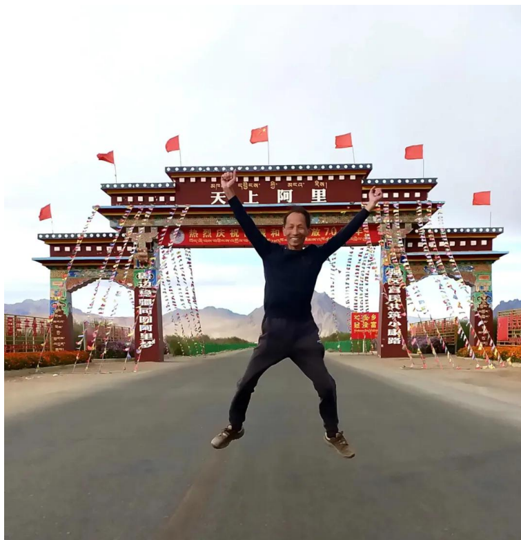
2021 年穿越阿里无人区