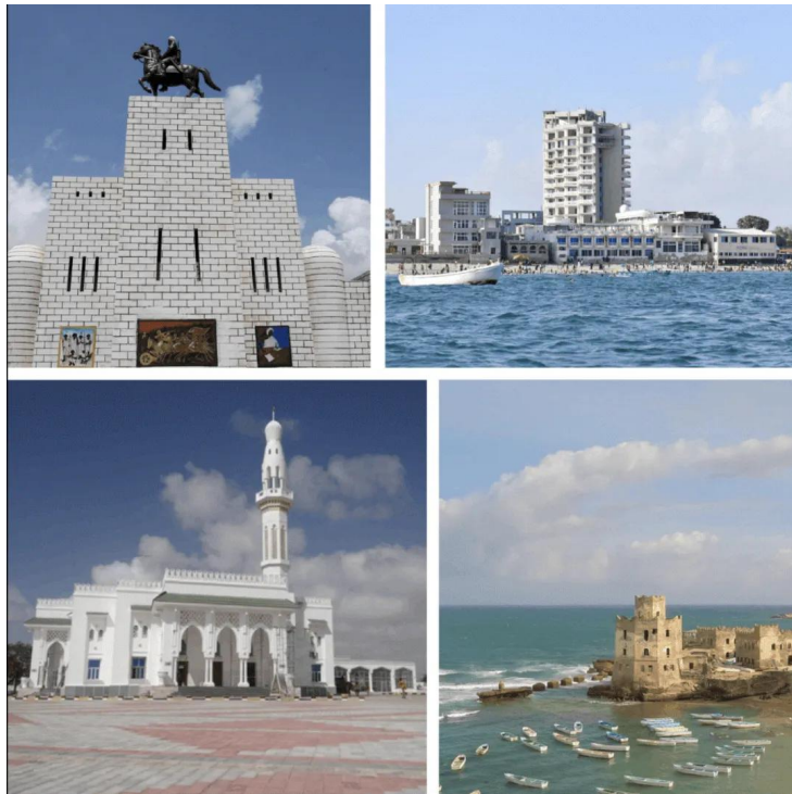
索马里首都摩加迪沙市区的美丽风光