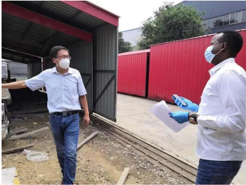
格第在港口检查发往肯尼亚的集装箱