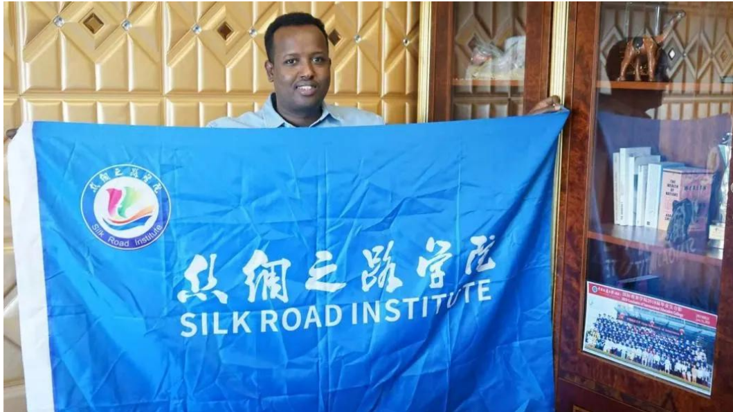
格第与丝绸之路学院院旗的合影

“新丝路”扬帆起航，他们一定会在这条倡导和谐、友谊、合作与共赢的道路上不负韶华，用智慧和汗水浇灌出属于他们最绚丽的青春之花。